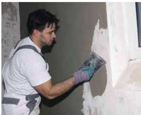
PCI® Pericret имеет пластичную консистенцию, удобен в применении

Тиксотропная сухая смесь для выравнивания вертикальных, горизонтальных и потолочных поверхностей